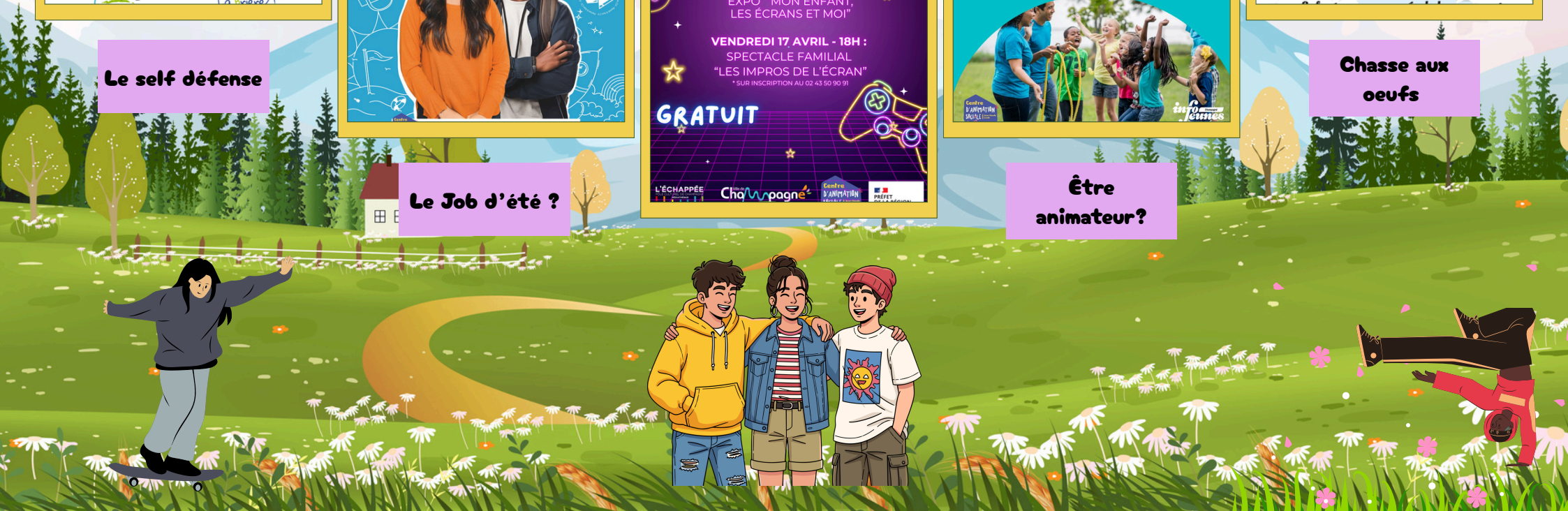
Chasse aux oeufs